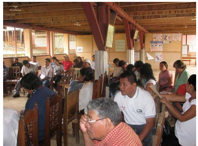
Vista general de los asistentes.

Cabe destacar que la participación de las mujeres dentro del taller fue activa, especialmente de las Religiosas que asistieron. Las mujeres evidenciaron su preocupación con respecto al tema de la seguridad del municipio, considerando que no es atendido por las instituciones responsables.